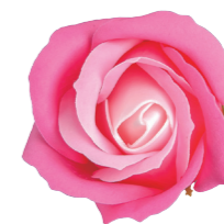
FSF09-03 <大箱>FSF09B-03 ライトピンク

グラデーションを きかせた新しいローズ。 アレンジに新鮮なイメージを 加えてくれます。