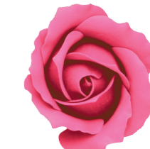
FSF17-08 <大箱>FSF17B-08 ホットピンク