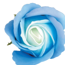
FSF09-25 <大箱>FSF09B-25 ブルー