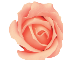
FSF17-62 <大箱>FSF17B-62 ピーチ