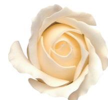
FSF17-40 <大箱>FSF17B-40 アイボリー