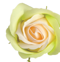
FSF09-30 <大箱>FSF09B-30 パステルグリーン