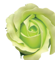
FSF17-30 <大箱>FSF17B-30 パステルグリーン