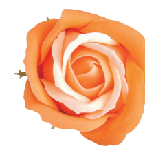
FSF09-72 <大箱>FSF09B-72 オレンジ