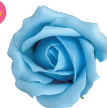
FSF17-45 <大箱>FSF17B-45 ニュアンスブルー