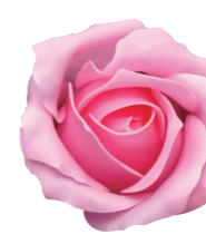
FSF17-03 <大箱>FSF17B-03 ライトピンク