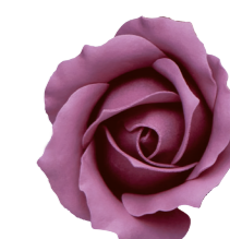
FSF17-12 <大箱>FSF17B-12 オーキッド