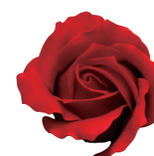
FSF17-20 <大箱>FSF17B-20 レッド