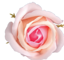
FSF09-05 <大箱>FSF09B-05 パステルピンク