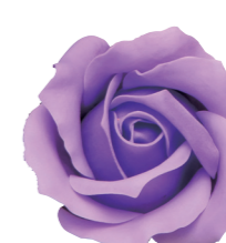
FSF17-39 <大箱>FSF17B-39 パステルライラック